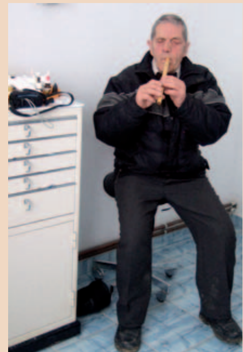
Als Dankeschön spielte ein Patient, der sieben Blasinstrumente beherrscht und schon Musikpreise gewonnen hat, auf der Hirtenflöte.